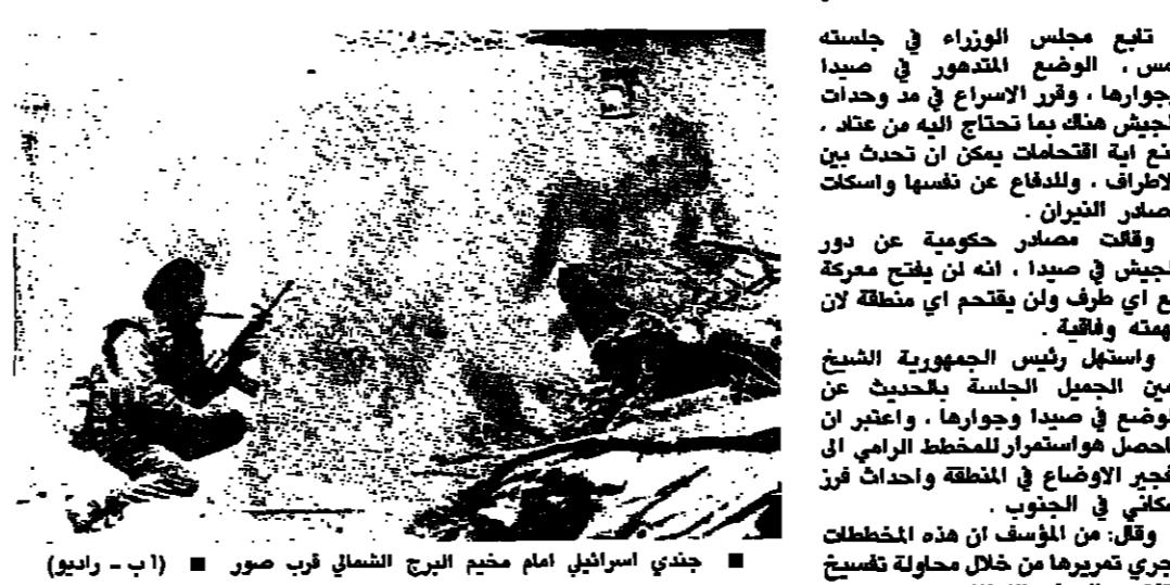
جندي اسرائيلي امام مخيم البرج الشمالي قرب صور

تبع مجلس الوزراء في جلسته امس، الوضع المتدهور في صيدا وجوارها، وفر الإسراع في وحدات الجيش هناك بما تحتاج اليه من عتاد. لنع اية التحركات يمكن ان تحدث بين الأطراف، والدفاع عن نفسها واستكات مصادر الثيران. وقالت مصادر حكومية عن دور الجيش في صيدا، انه لن يقف معركة مع أي طرف ولن يتقدم أي منطقة لن مهمته وفاقية. واستهل رئيس الجمهورية الشيخ امين الجميل الجلسة بالحديث عن الوضع في صيدا وجوارها، واعتبر ان ما حصل هو استمرار للمخطط الرامي الى تفتيح الأوضاع في المنطقة واحداث فز سكاني في الجنوب. وقال، من المؤسف ان هذه المخططات يجري تمريرها من خلال محاولة تصبغ وتفتيح الصف اللبناني في الجنوب، وفي هذه الظروف يتحتم ان يجتمع مجلس الوزراء بكامل اعضائه لمواجهة الاستحقاق الخطير. واكد الرئيس الجميل، ان الحكم والحكومة وسيمنان ان تعزيز قوات الجيش في منطقة الجنوب، واعتبر ان القيادات العسكرية اجتمعت على الحل هو في الواقع السياسي قبل الشان العسكري. وقال المطلوب منا وقفة وطنية جمعة شاملة لمواجهة الأخطار. موقف مسيحي